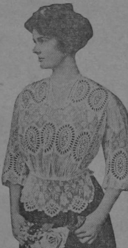
GRACEFUL NEW BLOUSE

Blusa de estilo moderno, confeccionada con encajes con ojos. Con cuello redondo y mangas de ¾ de codo de largas, cae lindamente bien a toda mujer.