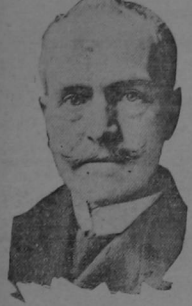
EL MAYOR STEINIGER DE BERLIN El doctor Karl Steiniger, primer Alcalde de la ciudad de Berlín consolidada (Greater Berlin) es el Presidente de la tercera municipalidad del mundo en punto a tamaño. La ciudad agrandada tiene 3,500,000 habitantes.