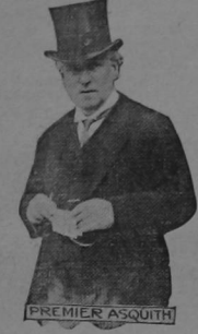
EL MINISTRO ASQUITH a cuyos esfuerzos se debe el arreglo favorable de la terrible "huelga negra" como se ha llamado la huelga de carbón en Inglaterra. El arreglo de la huelga ha consolidado nuevamente en el poder a Mr. Asquith.