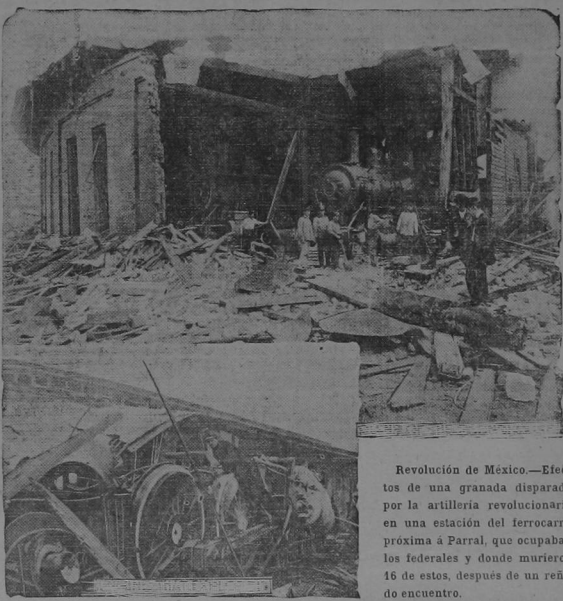
Revolución de México.—Efectos de una granada disparada por la artillería revolucionaria en una estación del ferrocarril próxima a Parral, que ocupaban los federales y donde murieron 16 de estos, después de un reñido encuentro.

ORTIZ renueva por cada correo su stock de joyería y recibe siempre lo más nuevo, lo más elegante, lo más artístico y lo ueb puede desear el gustomás refinado de esta capital